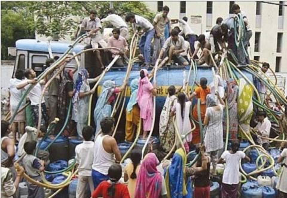
RESIDENTS of Sunjay Colony, a residential locality in New Delhi, crowd around a water tanker provided by the state-run Delhi Jal Board to fill their containers on Tuesday. Delhi Chief Minister Sheila Dikshit has given directives to the board to tackle the water crisis caused by an uneven distribution of water in the city.