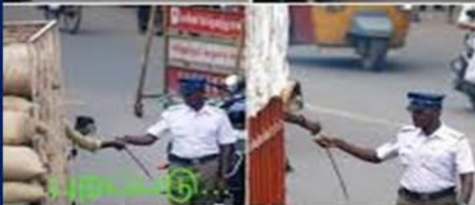
மேற்காவில் அங்கங்கடும் போலீசை பிராண்டியே பிரதானம் காணப்படும் அந்நகரில் வாகன நிரந்தரம். சந்திர வாகனங்களை கைப்பிட்டு பெருந்தொகை அனுப்பி விடுகிற இந்த போலீஸ்காரர்.